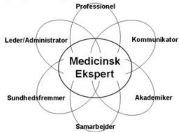
De syv speciallægeroller

Omfatter vor evaluering en bedømmelse af de 7 kompetencekrav?